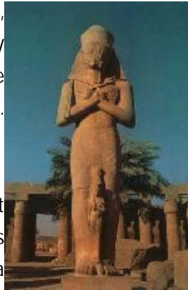
Figure 2: statue à Karnak

En Égypte, une statue est aussi vivante qu'un être humain animé. Sculptée à l'image d'une divinité, d'un roi ou d'un particulier, elle est véritablement l'être qu'elle incarne. C'est pourquoi on y inscrivait le nom et les qualités du personnage, car une statue hiéroglyphes perdait son pouvoir. Une statue exige les mêmes soins qu'un être humain, ainsi on inscrivait sur la statue des formules d'offrandes répétant pour l'éternité la liste des produits nécessaires à sa subsistance. Pour avoir une statue, on devait obtenir une concession royale. Les statues des hommes comme les scribes, les hauts dignitaires et les princes servaient à recevoir la protection divine pour celui qui était représenté. Elles servaient également à confirmer éternellement leur rang.