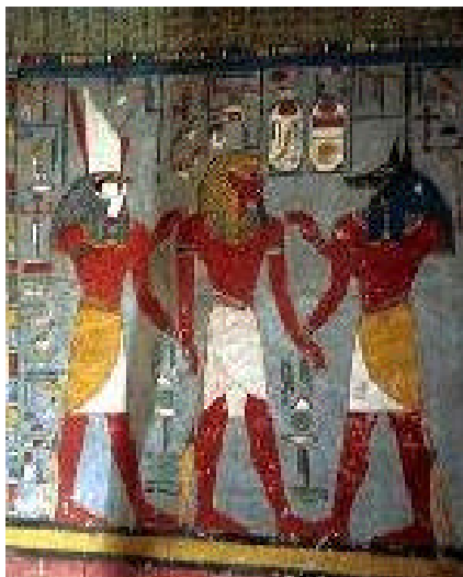
Figure 1: Peinture dans la tombe de Ramsès I

Pour un Égyptien, dessiner une chose, c'est la faire vivre. Ainsi, lorsqu'on mutilait ou supprimait un dessin, il n'était plus vivant. Le pouvoir de l'image était donc très fort. Le dessin ne reproduit pas ce que l'on voit, mais plutôt la réalité profonde des choses. C'est par conséquent une sorte d'écriture, et non une représentation fidèle de la nature.