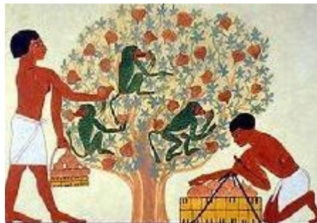
Figure 3: Cueilleurs de figes

Les aliments de base des anciens égyptiens étaient la bière et le pain, fabriqués à partir de l'orge et de l'amidonner. Les Égyptiens cultivaient également des légumes assez variés, tel que l'ail, le chou, le concombre, la fève, la laitue, la lentille, l'oignon, le poireau, le petit pois et le radis. Ils consommaient également des fruits comme des dattes, des figes, des grenades, des melons et des